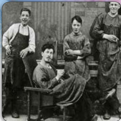
DocU: Gerrit Rietveld