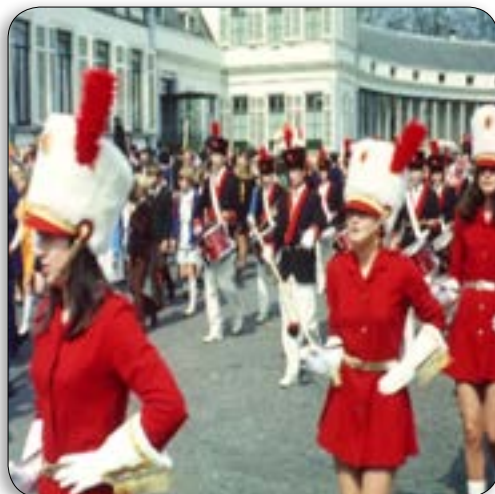
DocU: Leve het defilé

Meer dan ooit stond 2017 in het teken van de documentaires. Er werden er tientallen uitgezonden op RTV Utrecht, met name in de weekends en tijdens feestdagen. Een kleine greep uit het aanbod: